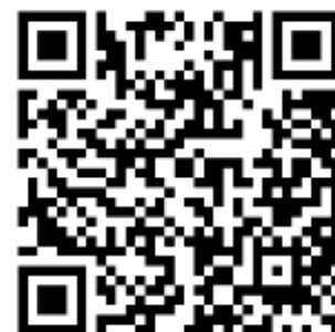
Ramadan in Nederland | رمضان في هولندا، استقبلنا وجه نظر المسلمين في الصوم - طابقتنا الفرح

Een getuigenis van onze evangelist: Een moslimman belde me en zei: 'Ik heb je hulp nodig want mijn vrouw en kinderen zijn door de jeugdbescherming weggehaald, maar ik houd van hen. Ik heb van mijn vriend gehoord dat jij mij kunt helpen.' Ik vroeg hem: Heeft je vriend (een andere volger van het YouTube-kanaal) ook verteld hoe ik hem heb geholpen? 'Ja zei hij, je hebt met hem gebeden in de naam van Jezus.' Oké zei ik laten we dat dan nu ook doen. We begonnen te bidden, maar toen ik amen zei, ging hij gewoon door om Jezus aan te roepen. Hij riep met herhaling en overgave: 'Jezus help mij'. Na het gebed vroeg ik hem: waar woon je? Hij bleek op slechts 800 m afstand te wonen van de Arabisch-Nederlandse gemeente waar ik als evangelist aan verbonden ben. Ik zei: O kom morgenavond dan naar onze samenkomst. Dat deed hij en sindsdien komt hij iedere zondag. Intussen heb ik ook contact kunnen leggen met zijn vrouw en de jeugdbescherming en we hopen dat het gezin weer kan worden herenigd.