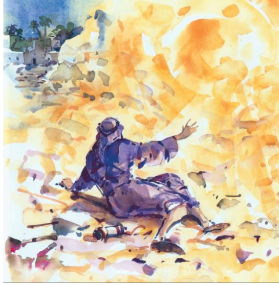
بولس في الطريق الى دمشق